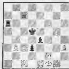
Mats divos gājienos.