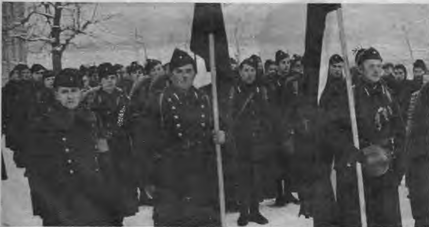
Latviešu vīri stājas cīnītāju rindās, lai kopā ar citām Eiropas tautām dotu pēdējo triecienu boļševismam.