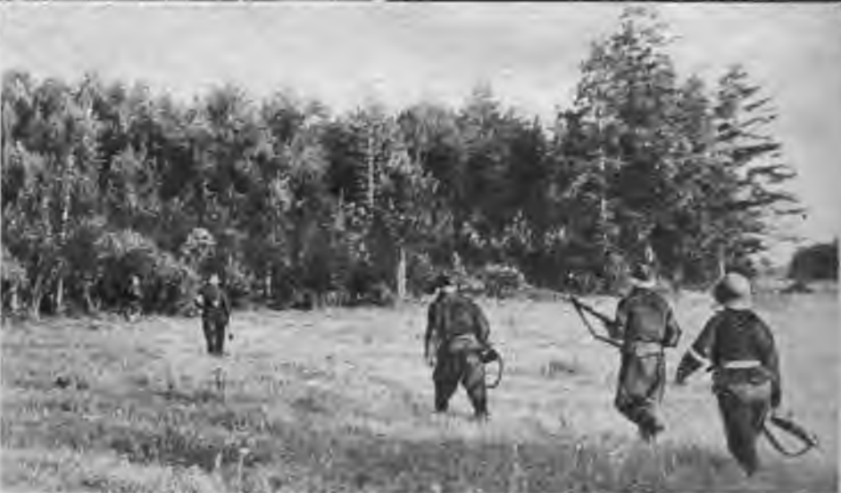
Mežu ielenkt dodas astoņi vīri.