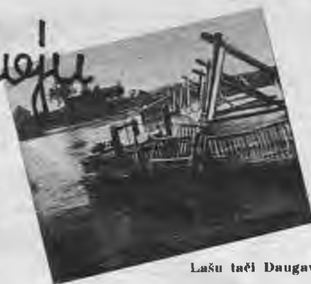
Lašu tači Daugava.

li lielus eksemplārus gan neizvejo, bet Atlantijas okeanā tās sasniedz 1,5 m garumu. Tādu zivi likko spēj pacelt viens virs. Tomēr „dīzjūrā“, pie Liepājas, gadās dažreiz nozvejot eksemplārus līdz 65 cm garumā.