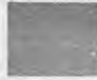
„Trīs puīšu polka”