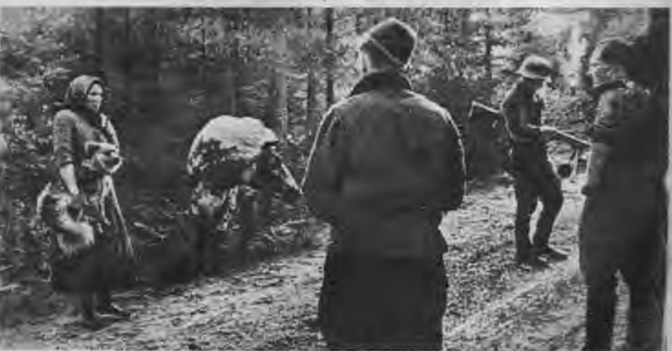
Uz stigas veca māmiņa ar ganāmpulku.