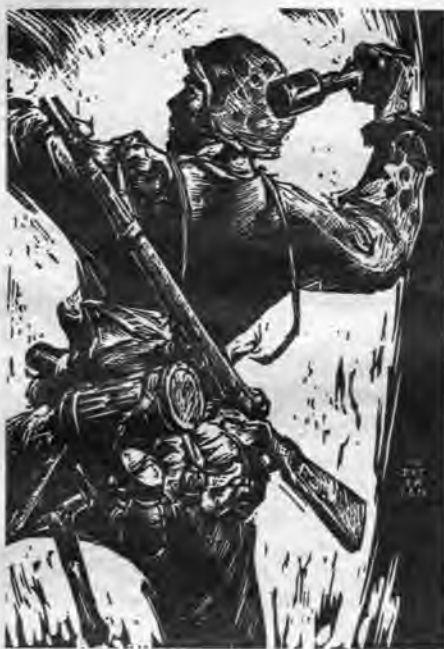
Granātu metējs. 44 vīrs iet uzbrukumā, tērples apkārtnē pieskaņotā plankumalnā (ziedu baltā) pārvelkamā jakā.

tie un blakus vācu karavīram par labāku rītdienu cinās visdažādāko Eiropas tautu dēli. Kur dažādas tautas, tur dažādas gaumes, bet labo saskaņu noteic vieno lais mērķis, un sadzīves omulību, kā labs un kultūrāls namatēvs, vada vācu karavīrs. Nekad netrūkst jautrības, anekdoti birst, ka spēj tik klausīties un smieties, bet nekad šai saimē nedzird rupjību, kas mūsu atmiņā vēl no cara laikiem tā saistās ar karavīru dzīvi. Latviešu zēns, kas atbraucis atvaļinājumā no savas SS vienības, to atzīmē ar lielāko prieku. Nefrūkst arī mūzikas, jo vācu karavīri vispār ļoti mūzikāli: labprāt dzied un spēlē dažādus instrumentus. Šis karavīru dziesmiņas mēs jau pazīstam arī aizmugurē: drusku sentimentālas — par dzimteni, milu un draugu. Tās krasi atšķiras no veselu gadu dzirdētajām gaudu dziesmām par godu Staļinam, Vorosilovam, Budjonnijam, Čapajam un