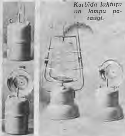
Karbīda lukturu un lampu pa- raugi.