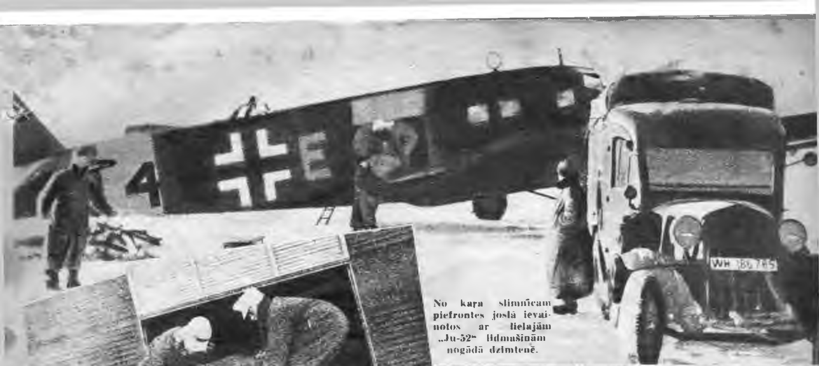
No kara slimnīcām piefrontes joslā ievai- notos ar lielajām „Ju-52” lidmašīnām nogādā dzīvītu.