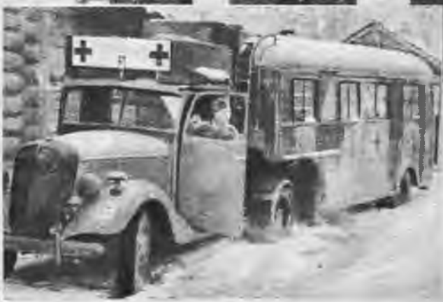
Arī lidmašīnas apka- pe dodas palīga ievai- noto novietošanai. austrumu lidlaukā vi- da stīndzīnošs sala