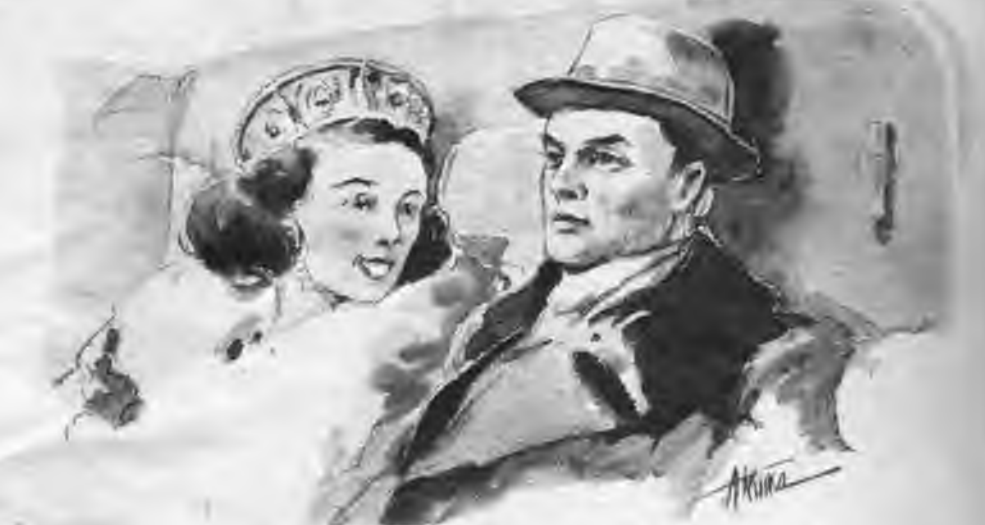
Zilā bezdelīga joņoja ārā no pilsētas tik vieglā, ātrā un slidošā gaitā, ka čigāniete nesavaldīja prieka kliedzienu.

Pēc dejas sakarsusī čigāniete nedabūja ne atjēgties, kad Antons ap pleciem viņai aplika kādu kažoku un pa pusei nešus cauri tumšam, šauram blakusgaitenim izveda laukā, kur baltā ziemas naktī viņus gaidīja Antona jaunā, zilā mašīna ar skaisto Riču