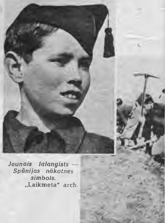
Jounais falangists — Spānijas nākotnes simbols. „Laikmeta” arch.

Nacionālās Spānijas falangā organizeta jaunatne jau no bērnu dienām mācās lauksaimniecības darbus. „Laikmeta” arch