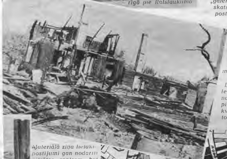
Izdegušā Ilguciema manufaktūras fabrika