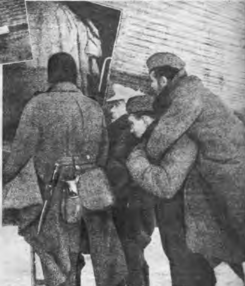
Rūpīgi un uzmanīgi ievainotos novieto lid- mašīnā. Ievainotie ku- pavīri zina, ka dara visu, lai saglabātu viņu dzīvību un vese- lību.