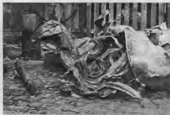
Tas kādreiz bija Rīgas ainavā pazīstamais Pēterļa torņa gailis.