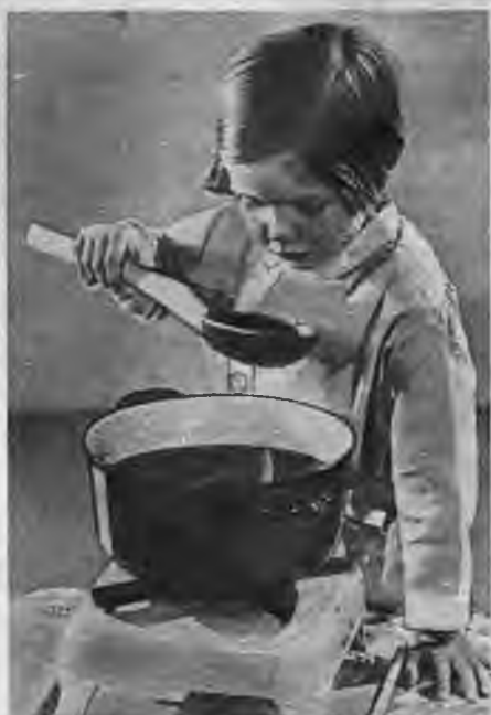
Kā garšo jaunais ievārijums?