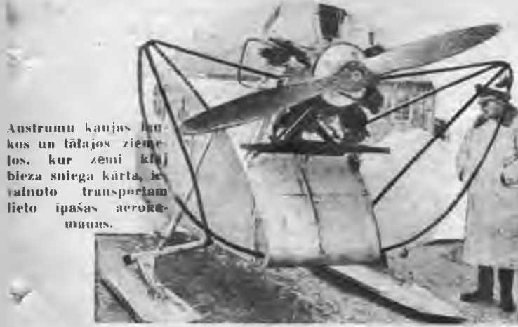
Austrumu kaujas lau- kos un tālajos ziemē- los, kur zemi klāj bieza sniega kārtas, ie- vainoto transportam lieto īpašas aerokra- matus.

Ievainotais karavīrs ir pirmā vieta. Viņam pieder pirmas rūpes, jo viņš savai tēvzemei devis vairāk kā citi — savas asinis. Līdz ar pirmām vienībām austrumu frontē atrodas arī kara sanitārais personāls — ārsti, māsas un sanitāri. Apgādāti mērķnākiem, ārstniecības līdzekļiem, sanitārām mašīnām un medikamentiem, ārsti ar saviem palīgiem gādā, lai ievainotie saņemtu pēc iespējas ātru palīdzību. Frontes priekšējās līnijās izdara ne tikai pārsējumus, bet arī vieglākas operācijas. Smagākos gadījumos ievainotos ātrās palīdzības mašīnās nogādā tālāk aizmugurē iekārtotās slimnīcās, kur iespējams izdarīt arī lielākas operācijas. No kara slimnīcām piefrontes joslā ievainotos, kuriem nepieciešama ilgāka ārstēšana, nogādā valsts iekšienē. Slimnieku transportu veic lielās „Ju-52” lidmašīnās, kas īpaši iekārtotas slimnieku pārvadāšanai. Sanitārā transporta lidmašīnas pavada t. s. lidojošās māsas, kas visu ceļojuma laiku rūpīgi gādā par ievainotiem. Ilgāk ārstējamus ievainotos pārvieto uz dzimtenes slimnīcām, dodot viņiem iespēju salikties ar pie derīgiem. Tādā kārtā īsnot slimnīcā pavadāmo laiku. Kl.