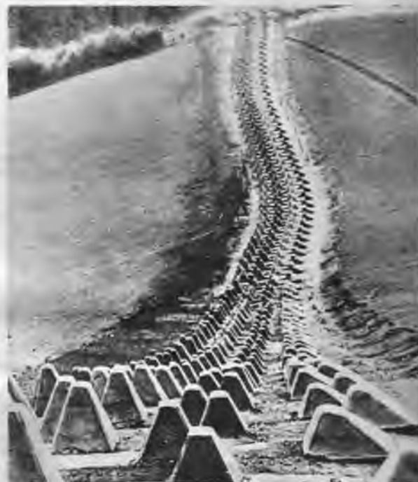
Viens no labākajiem Dr. Todt'a darbiem Vācijas robežos bija rietumu valņa izbūve. Išā laikā gar Vācijas robežu radās nepārvarama bunkuru un tanku aizsardzības sistēma.