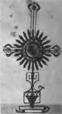
Sprēsliecas ar saules zīmēm.