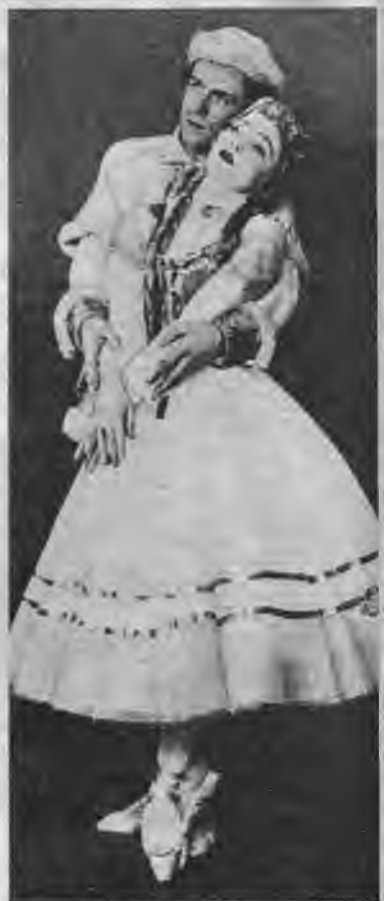
M. Lence un R. Saule tautu meita tautu dēls.