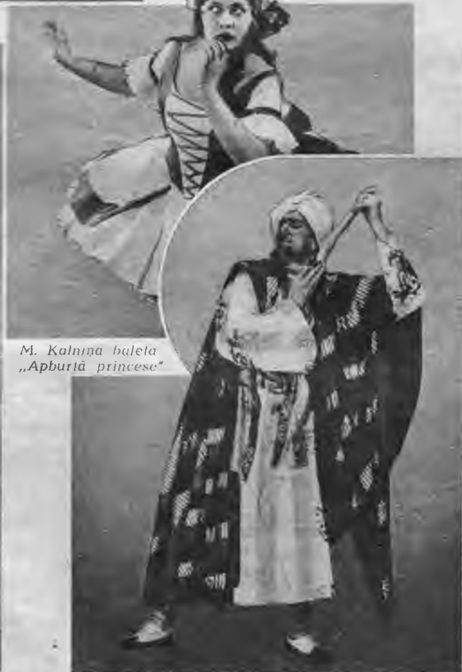
M. Kalniņa baleta „Apburā princese”