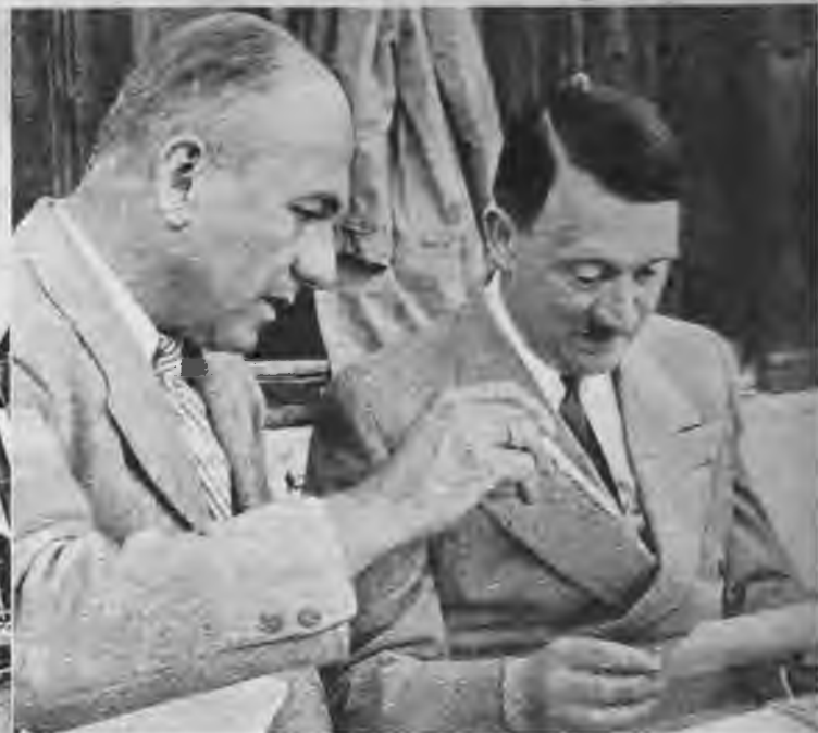
Novērtējot Dr. Todt'a spējas un organizatora talantu, Vadoņa uzdeva viņam autoceļu būvi. Vadoņa un Dr. Todt'a apspriestais autoceļu izbūves plāns.