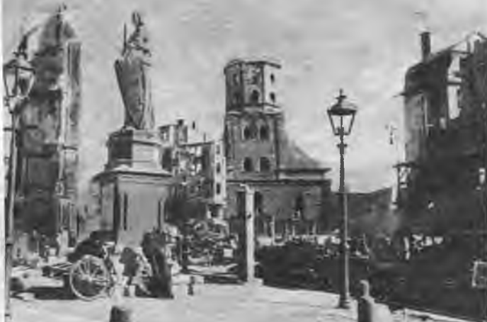
Postījumu aina iekš- rīgā pie Rātslaukuma