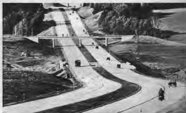
Krustām šķērsām cauri Vācijai stiepjas lieliskie autoceļi, kas audžu paaudzēm stāstot par Dr. Todt'a un viņa vīru veiktajiem darbiem.