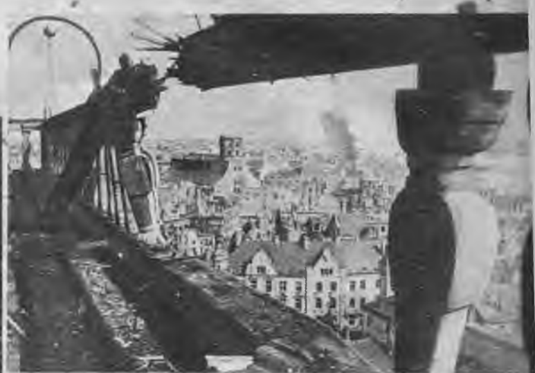
No kara laika bojātās Doma baznīcas torņa galerijas paveras plašs skats uz bojševiku iz- postīto Rīgas centru.